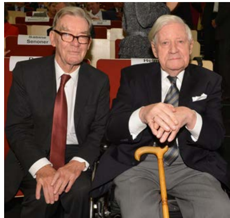
Prof. Dr. Reimar Lüst und Altbundeskanzler Helmut Schmidt in Hamburg am 12. November 2012 in der Bucerius Law School anlässlich der Verleihung der Ehrenmedaille der ZEIT-Stiftung Ebelin und Gerd Bucerius an Prof. Lüst.

1972 übernahm Reimar Lüst die Präsidentschaft der Max-Planck-Gesellschaft für 12 Jahre bis 1984. Die folgenden sechs Jahre zeichnete er als Generaldirektor für die European Space Agency (ESA) verantwortlich. Von 1989 bis 1999 führte er die Alexander von Humboldt-Stiftung als Präsident. Er hat zudem entscheidend die Gründung der Jacobs University in Bremen vorangetrieben. In die Planungskommission der vormals „International University Bremen“ wurde Reimar Lüst 1998 berufen; den Aufsichtsrat der neu gegründeten Universität leitete er als Vorsitzender von Februar 1999 bis Dezember 2004. Bis heute ist Reimar Lüst Ehrenvorsitzender des „Board of Governors“ der dann in Jacobs University umbenannten Einrichtung; anlässlich ihres 10-jährigen Jubiläums wurde Reimar Lüst die erste Ehrendoktorwürde verliehen.